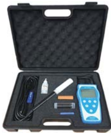
[ Full set 구성 ]